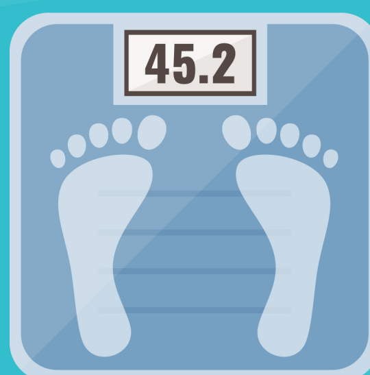
PERDIDA DE PESO